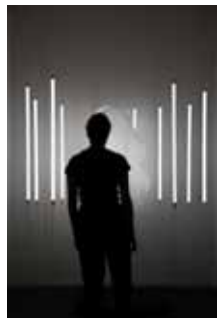
7. Milda Vyšniauskaitė Mimosa Pudica (2018)