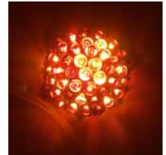
12. Oscar Peters Contact Light (2018)