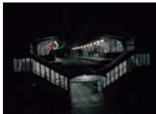
8. Arianne Olthaar Schwebbahn (2016)