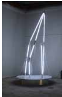
2. Anaïs Borie (DzAE) Modern Zeus02 (2017)