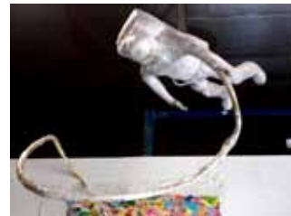
3. Robert Roelink The search for water and new light (2018)