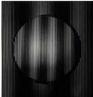
4. Daphne Glasmacher Moon (2016)