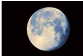
1. Paul Baartmans Blue Moon (2015)

Op 24 december is het precies 50 jaar geleden dat Apollo 8 als eerste bemande ruimtevaartuig succesvol in een baan om de maan zweefde en op die manier de kosmos verkend werd. De zichtbare kosmos om ons heen omvat dat deel waarvan het licht sinds het “begin der tijden” ons heeft kunnen bereiken. LichtKunstGouda 2018 van Kunststichting Firma Van Drie toont het publiek door middel van vijftien lichtkunstwerken onderdelen uit de kosmos, waaronder de maan, zon, planeten, sterren, een kosmonaut, ruimtevaartuig en satelliet. Op vier locaties zijn de speciaal voor dit project bijeengebrachte werken van diverse kunstenaars te zien.