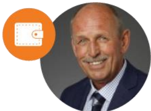
Alderman Economic Affairs, Tourism and Education