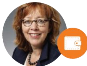
Alderman Seniors policy, Youth Care, Health Care