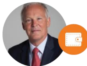
Mayor of Noordwijk