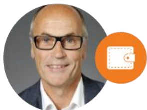
Alderman physical planning, living