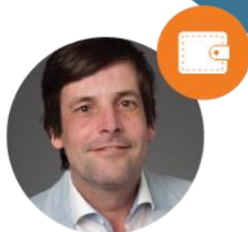
Alderman Social Affairs, Employment, Integration