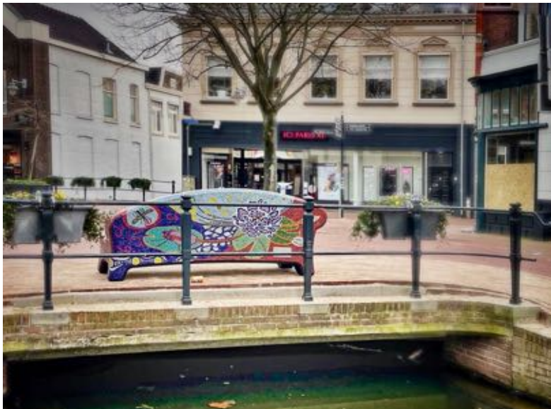
Foto van achteren

We hebben inmiddels geleerd dat een SocialSofa op een grotere schaal fungeert dan een straat of buurt. Zeker de PlateelSofa is een ontmoetings- en rustplek voor wandelaars op de schaal van de binnenstad.