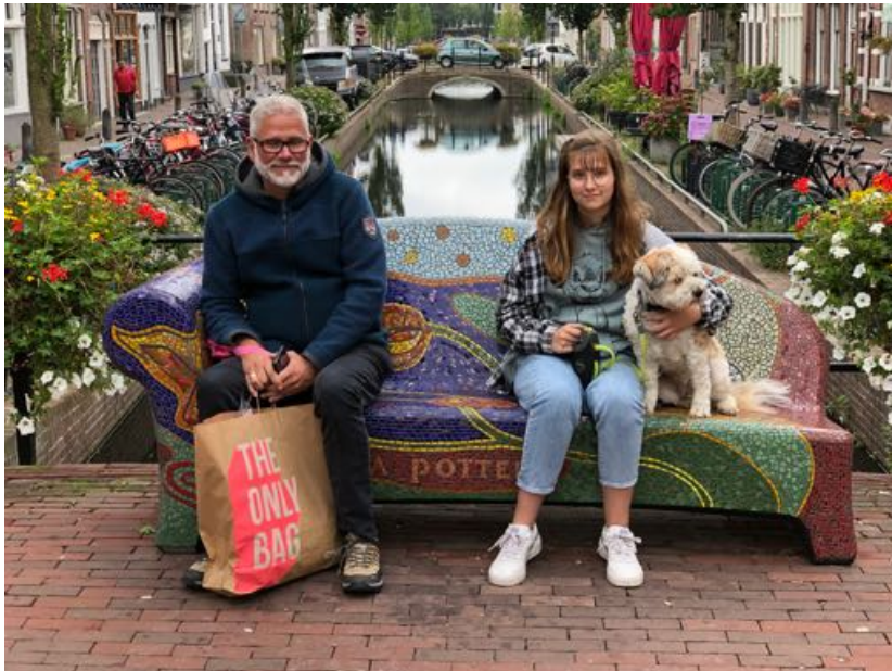
PlateelSofa in gebruik

Een complicatie was de Corona pandemie, waardoor de mozaïekers afstand moesten houden. Er was ontsmettingsmiddel voor de handen en velen hebben een masker opgezet. Door de hygiëne maatregelen konden alleen 3 mensen tegelijk (soms 4) aan de Sofa werken. Door de kleine groepen was het ook lastiger om afspraken te maken. Spontaan binnen lopen en beginnen was niet mogelijk. Vooral in het begin is gezocht naar een goede manier van afspraken maken. Achteraf is gepleit voor het maken van afspraken via internet, maar tot nu is geen goede digitale techniek (zoals datumprikker) gevonden.