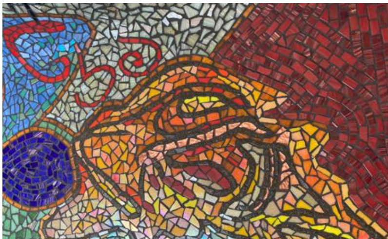
Foto: Detail sofa van boven gezien